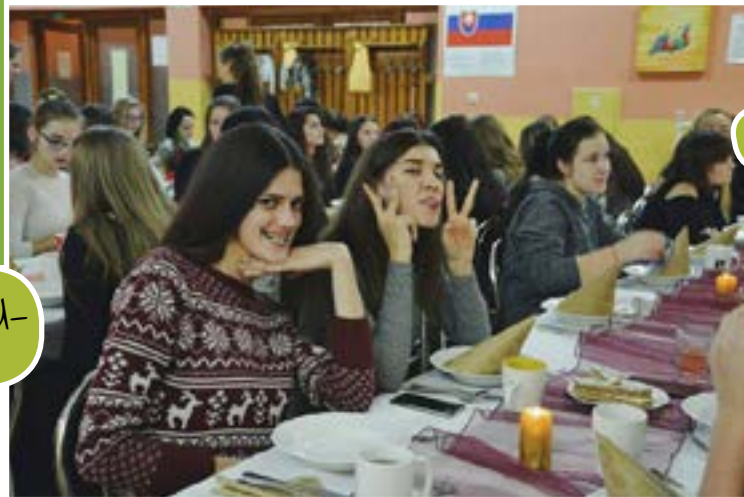
••ASPOŇ SME SA NAJEDLI!••