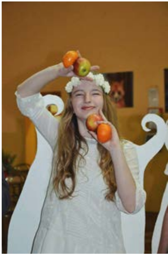
••ZLÍ SI PRIŠLI NA SVOJE A MIKU- LÁŠ MOŽNO TEŽÍ!••