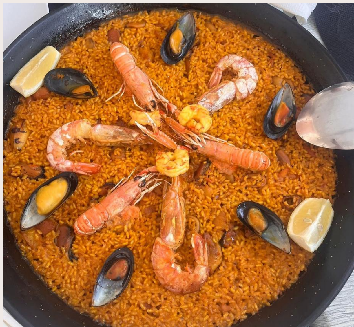
Paella de marisco