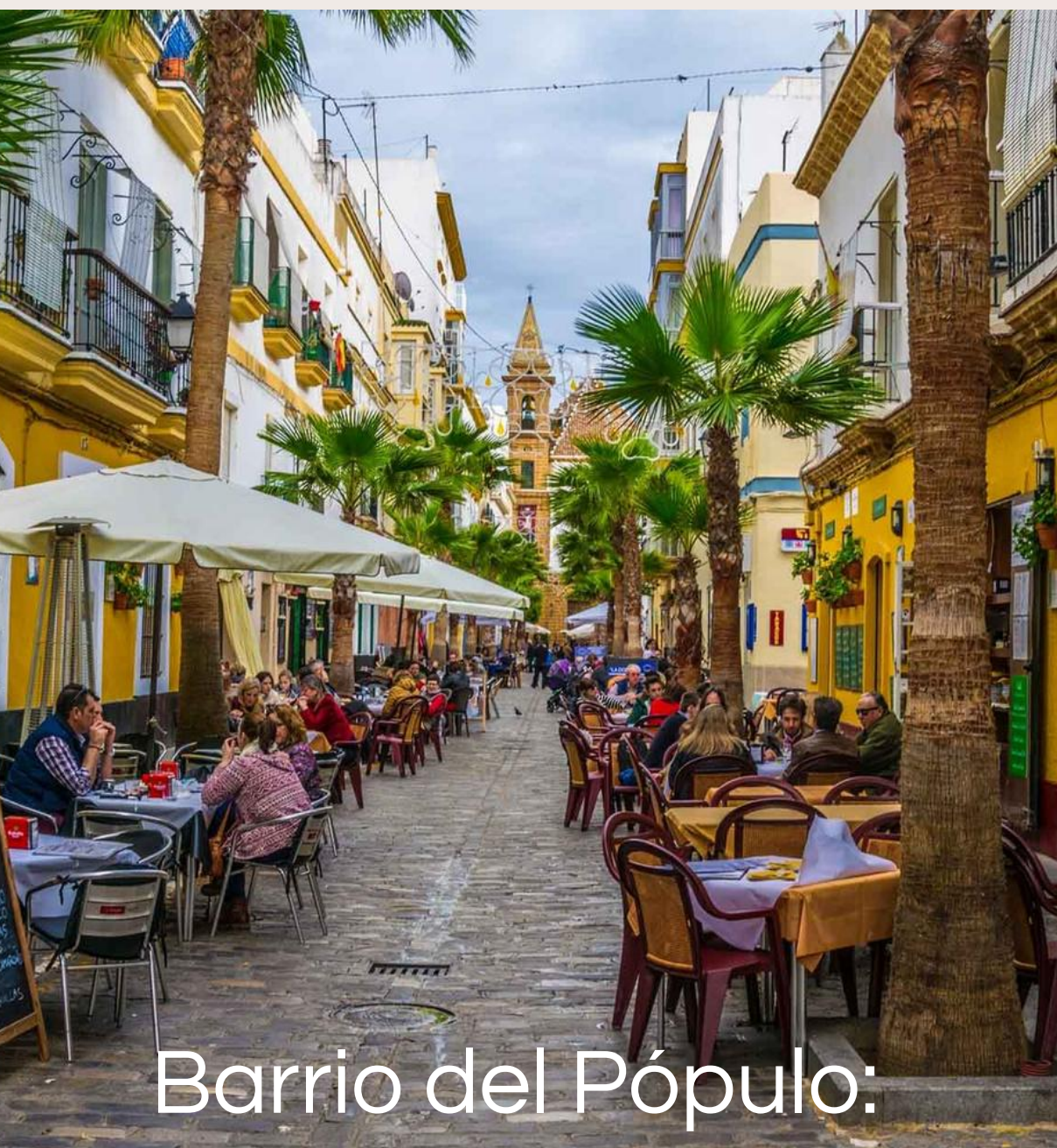
Barrio del Pópulo:

Najstaršia štvrť s úzkymi uličkami a kamennými bránami