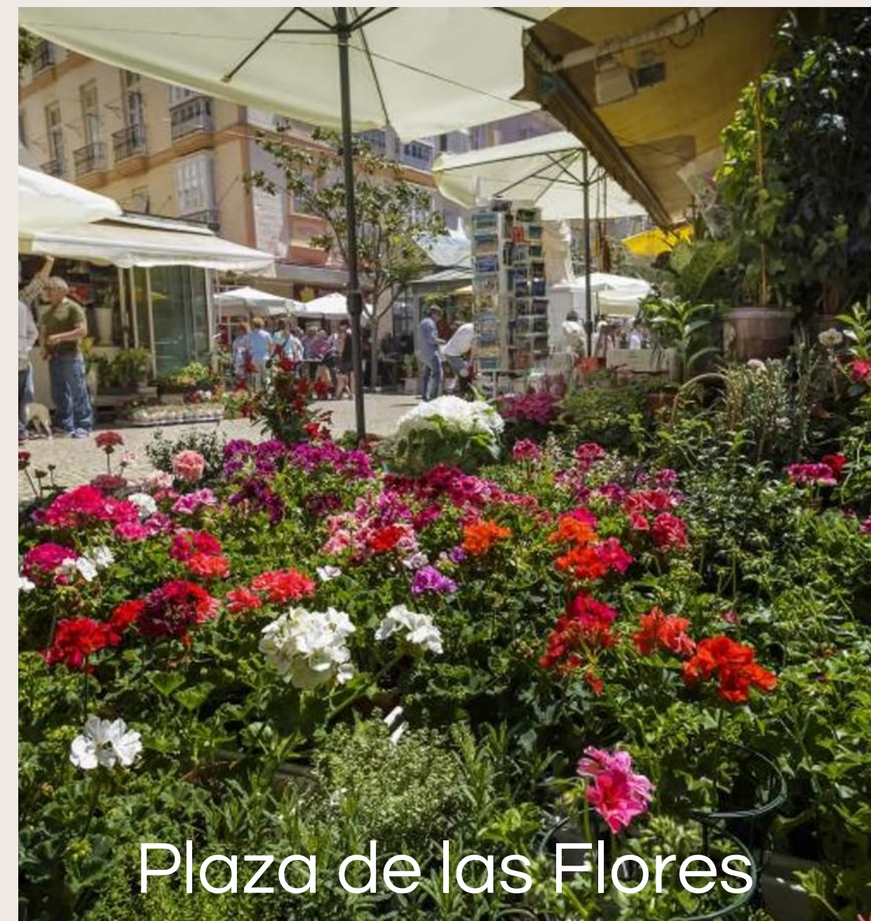
Plaza de las Flores

Radnica na námestí Plaza de San Juan de Dios