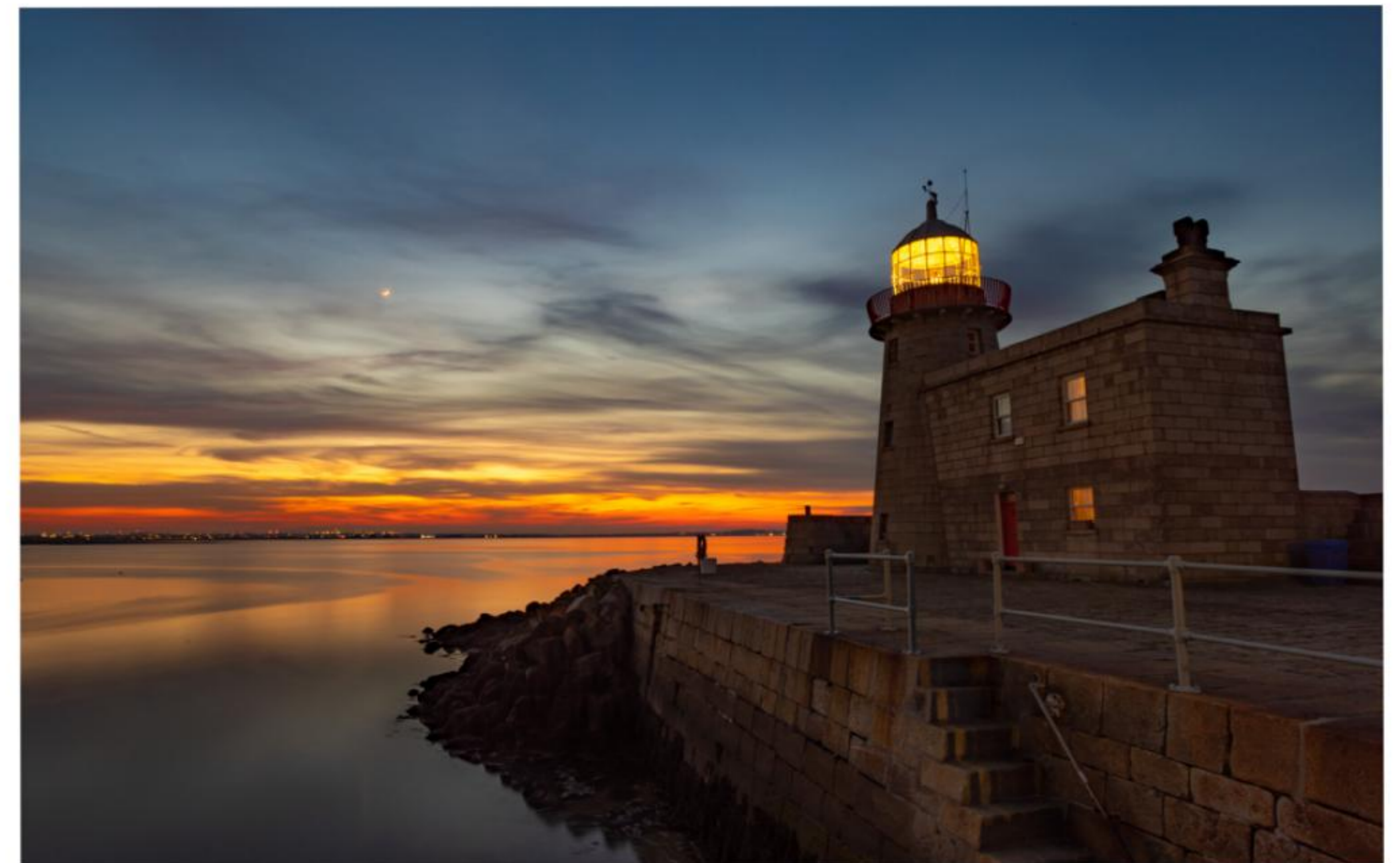
Howth Lighthouse at Sunset

Je to ideálne miesto na únik z rušného mesta, kde si môžete vychutnať čerstvý morský vzduch a sledovať trajekty vchádzajúce do prístavu.